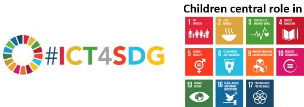
Слика 1. Дјецу, информационе и комуникационе технологије (ИКТ) и циљеви одрживог развоја (СДГ)

Агенда за одрживи развој до 2030. препознаје да информационе и комуникационе технологије (ИКТ) могу да буду кључни фактор за постизање циљева одрживог развоја. Ширење информационе и комуникационе технологије (ИКТ) и глобална међусобна повезаност потенцијално могу да убрзају људски напредак, премосте дигиталну подјелу и развију друштва знања. Оно даље дефинише специфичне циљеве за употребу ИКТ-а за одрживи развој у образовању (Циљ 4), родну равноправност (Циљ 5), инфраструктуру (Циљ 9 - универзалан и повољан приступ интернету) и Циљ 17 - партнерства и средства за имплементацију 1 . ИКТ имају моћ дубоке трансформације економије у цјелини чинећи покретачку снагу у постизању сваког од 17 циљева одрживог развоја. ИКТ су свој потез већ покренули дајући могућности милијардама појединаца широм свијета - пружајући, између осталог, приступ образовним ресурсима и здравственој заштити, те услугама попут е-управе и друштвених медија.